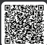
ลงทะเบียน เข้าร่วมการสัมมนา

โรงแรมอัสวีนิ แกรนด์ คอนเวนชั่น กทม. และผ่านสื่ออิเล็กทรอนิกส์ (ระบบ ZOOM)